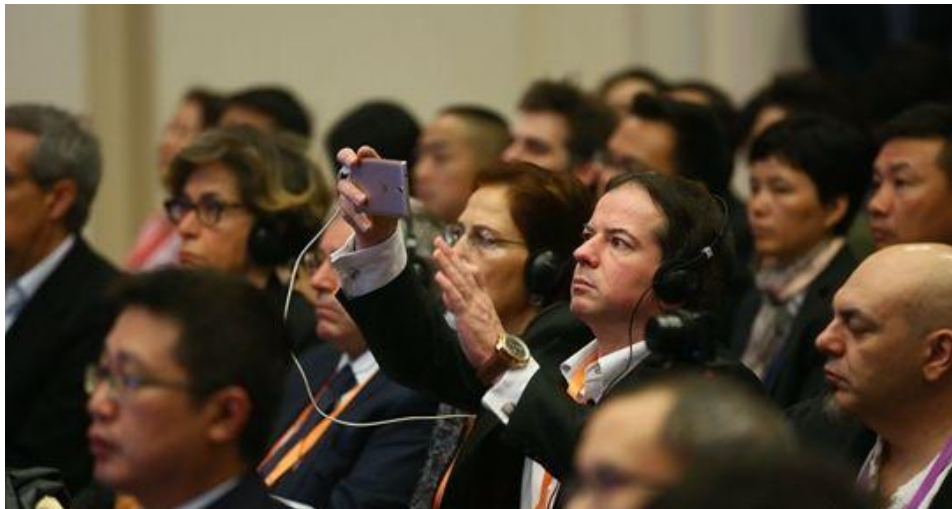
“海丝之路 开放平台 航运枢纽——南沙新区、自贸区南沙片区推介会”现场。

荷兰比卢商会、洛杉矶中华总商会、英国中华总商会商业协会等高层及会员企业代表，中国行政管理学会、北京理工大学珠海学院、中山大学自贸区研究院等教育科研机构代表等近 150 人参加。广州市委常委、南沙开发区(自贸区南沙片区)管委会主任、南沙区委书记丁红都，南沙开发区(自贸区南沙片区)管委会常务副主任、南沙区代区长曾进泽，以及南沙开发区(自贸区南沙片区)管委会有关领导、有关部门负责人出席了活动。