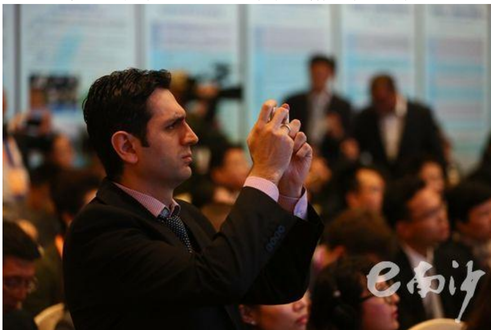
“海丝之路 开放平台 航运枢纽——南沙新区、自贸区南沙片区推介会”现场。